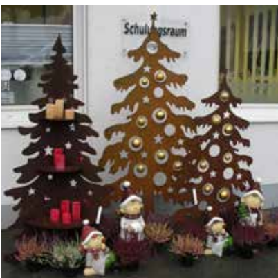
Auch draußen wurde dekoriert