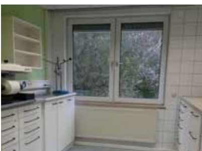
Unsere Gipsküche war kaum wiederzuerkennen