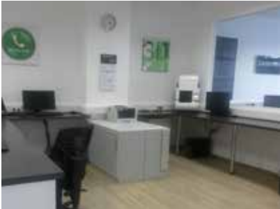
Das Sanitätshaus hatte – gefühlt – fast seinen ganzen Laden mitgebracht